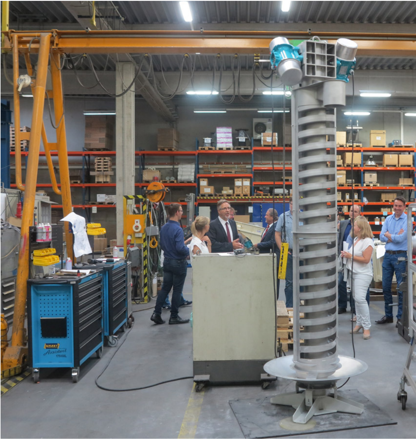
Endmontagebereich: Wendelförderer „live“ in der Abstimmungsphase