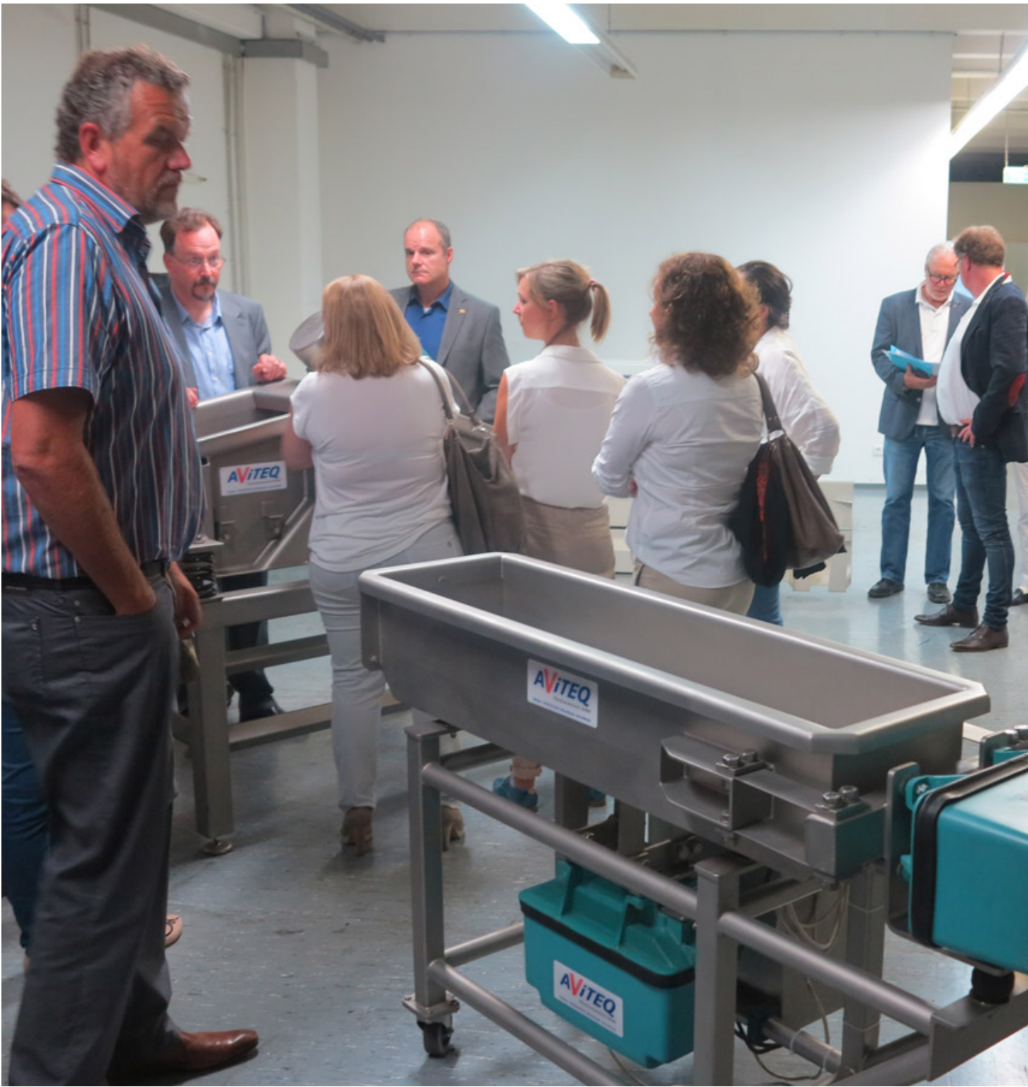
AVITEQ Showroom mit diversen Messeexponaten (im Vordergrund: Reversiererinne mit Magnetantrieb)