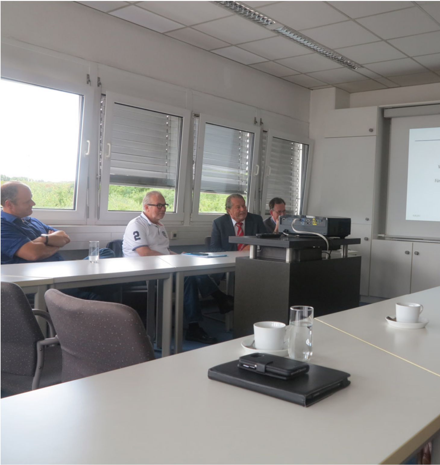
Die Geschäftsleitung berichtet über die Aktivitäten der AViTEQ von der Vergangenheit bis heute