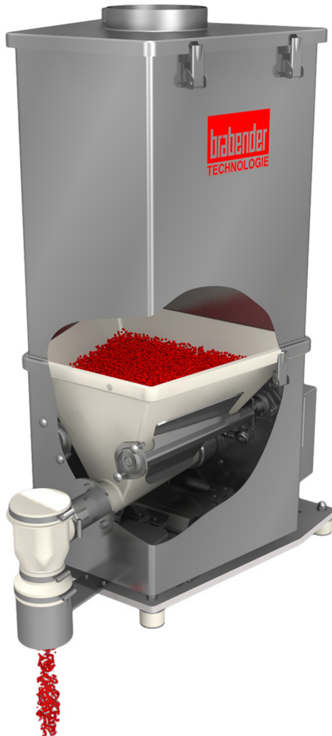
Abb. 4: FlexWall®Plus (2001)

Lauf. Mit führenden Herstellern der Lebensmittelindustrie lanciert das Unternehmen Ende der 1990er Jahre eine erste Dosierlinie im ‚Hygienic Design‘, die höchste Anforderungen erfüllt. Der Grundstein für ein weiteres Standbein in der Lebensmittel-, und später der Pharma-Industrie, ist gelegt.