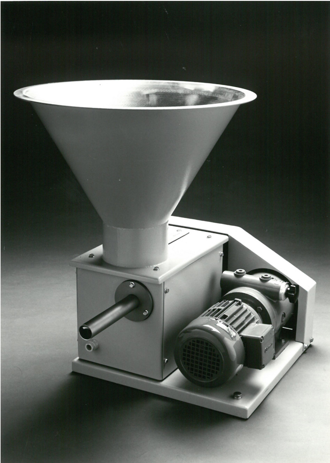
Abb. 3: Vibrationsdosierschnecke (1979)

Mit der Einführung der Feldbustechnik für gravimetrische Dosiergeräte schafft es das Unternehmen im Jahr 2000, eine Brücke zwischen analoger und digitaler Kommunikation zu schlagen. Die Entwicklung ‚intelligenter‘ waagenmontierter Steuer- und Leistungsmodule nimmt im selben Jahr mit der ISC-CM/FC seinen